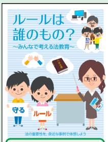
小学生向け 冊子教材(H25作成)