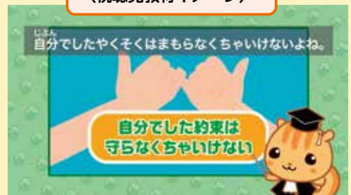
小・中学生向け 視聴覚教材 (H30作成)