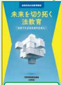
高校生向け 冊子教材(H30作成)