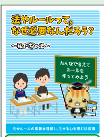
中学生向け 冊子教材(H26作成)